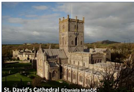
St. David's Cathedral

Übernachtung im Raum Tenby/ Pembrokeshire, F/A