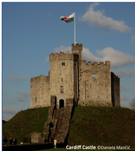
Cardiff Castle

Nach einer gemeinsamen Stadtrundfahrt bleibt Ihnen Zeit für eigene Erkundungen. Besuchen Sie Cardiff Castle mit seiner normannischen Motte aus dem 11. Jh., entdecken Sie die vielen viktorianischen Einkaufspassagen mit ihren kleinen Geschäften und Cafés, die Welt des Rugby mit einer Führung durch das Principality Stadium oder wie wäre es mit einem Spaziergang am Fluss Taff mit anschließender Bootsfahrt in der Cardiff Bay? Übernachtung im Raum Cardiff, F/A