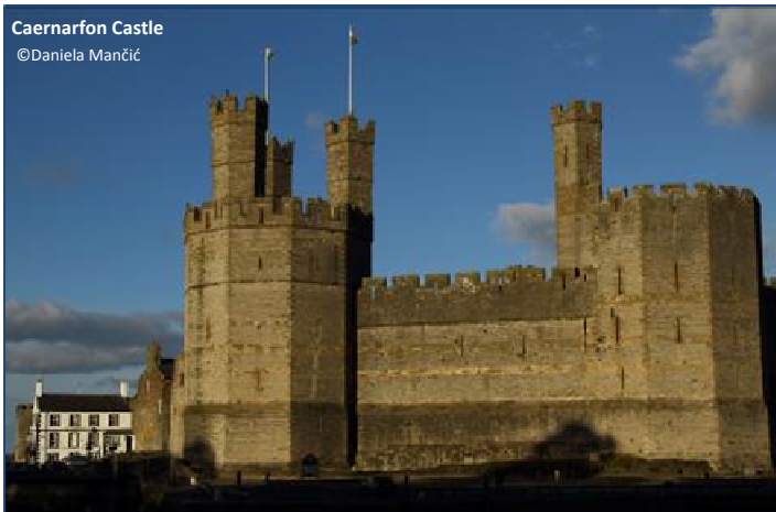
Caernarfon Castle