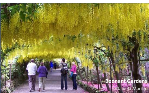
Bodnant Gardens

Übernachtung im Raum Prestatyn/ Llangollen, F/A