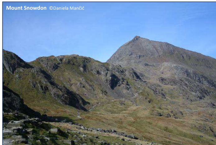
Mount Snowdon

Schlendern Sie im Anschluss durch die engen Gassen und lauschen sie den Einheimischen, die hier noch zu 73% Walisisch sprechen.