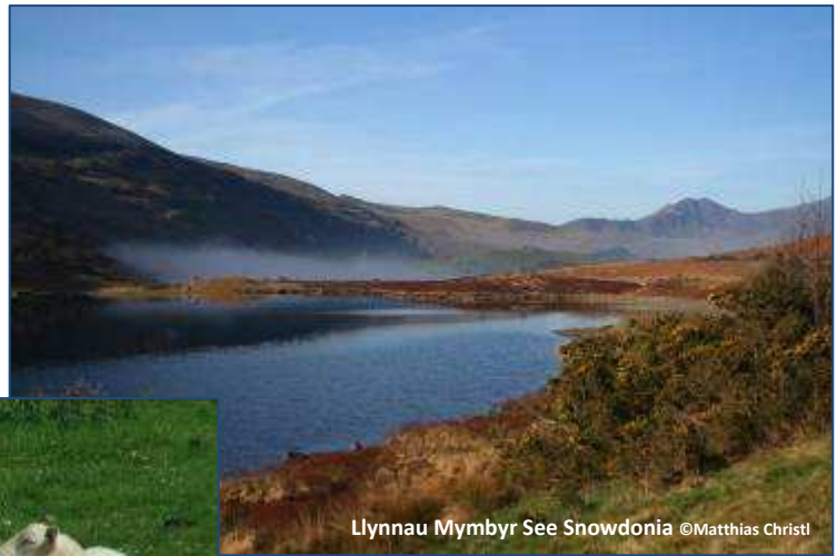
Llynau Mymbyr See Snowdonia