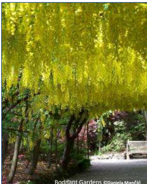
Bodnant Gardens

Heute besichtigen wir Bodnant Garden . Er gehört zu den schönsten Gärten Großbritanniens und ist mit seinen Seerosenbecken, Rhododendrenbüschen, Azaleen, Hortensien und Bäumen aus aller Welt zu jeder Jahreszeit ein botanisches Erlebnis. Der Garten passt sich wunderbar in die Landschaft des Conwy Tales ein. Wir wollen uns Zeit lassen, die Vielfalt der Pflanzen und unterschiedlichen Landschaftsstrukturen fotografisch zu entdecken.