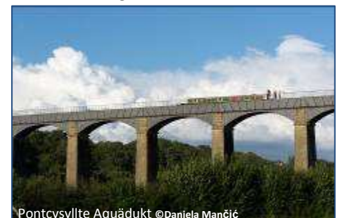
Pontcysyllte Aquädukt

Dem pittoresken Städtchen Llangollen am River Dee mangelt es nicht an interessanten Fotomotiven. Mit seiner Burgruine aus dem 13. Jh., Dinas Bran , der Valle Crucis Abtei (ebenfalls 13. Jh.), dem Llangollen Kanal , mit seinen bunten Hausbooten, den hübschen Geschäften und Antiquariaten und vielen Cafés und Pubs ist Llangollen das ganze Jahr über ein Magnet für Besucher aus dem In- und Ausland. Hier bietet sich auch die Gelegenheit, einen typischen walisischen Cream Tea in einem der vielen Cafés zu genießen oder die Fotosession gemütlich bei einem kühlen Getränk im Pub am Fluss ausklingen zu lassen.