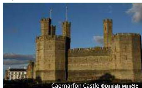
Caernarfon Castle

Die Bilder des Nachmittages werden in einer gemeinsamen Runde nach dem Abendessen besprochen.