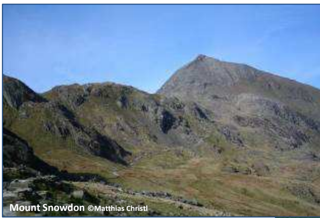
Mount Snowdon